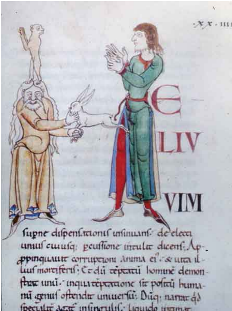
Fig. 2 - Lettera capitale "H". Moralia in Job (Cîteaux, XII sec.) Digione, Biblioteca Municipale