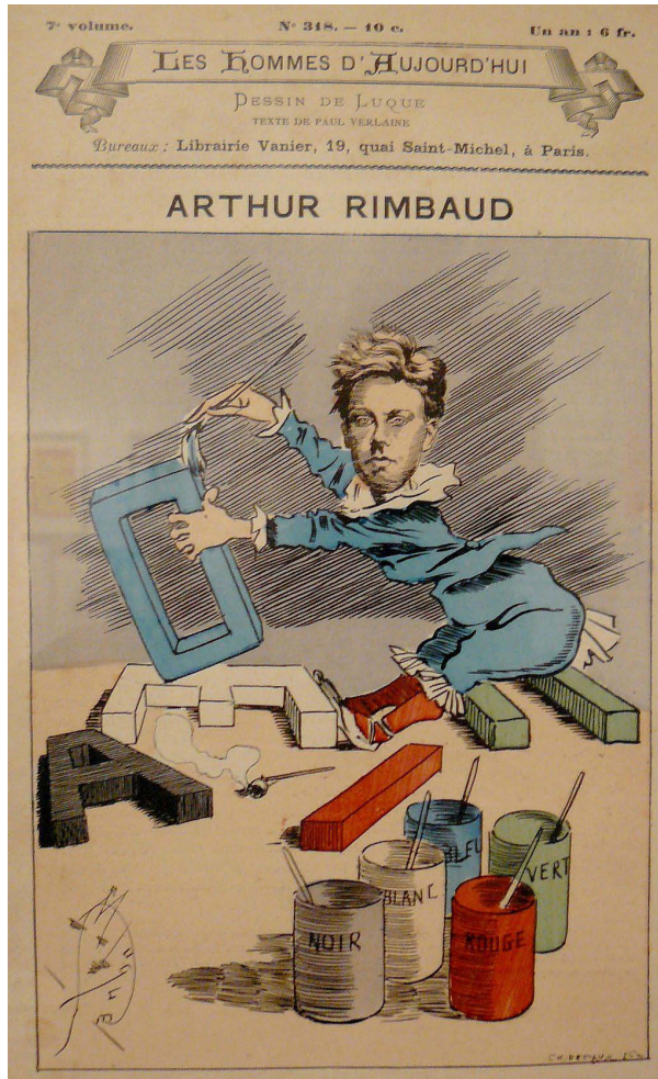
Fig. 4 - Caricatura di Rimbaud con le sue Vocali Manuel Luque de Soria, Les Hommes d'aujourd'hui , n° 318, gennaio 1888.