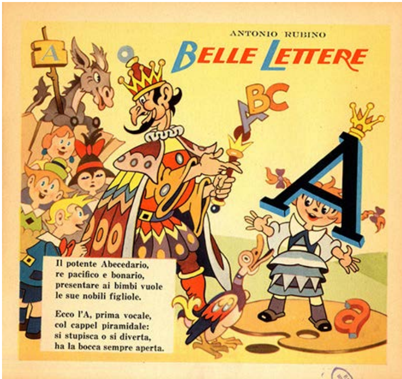
Fig. 3 - La Lettera A e l'Abecedario personificati Antonio Rubino, Belle Lettere , Milano 1922