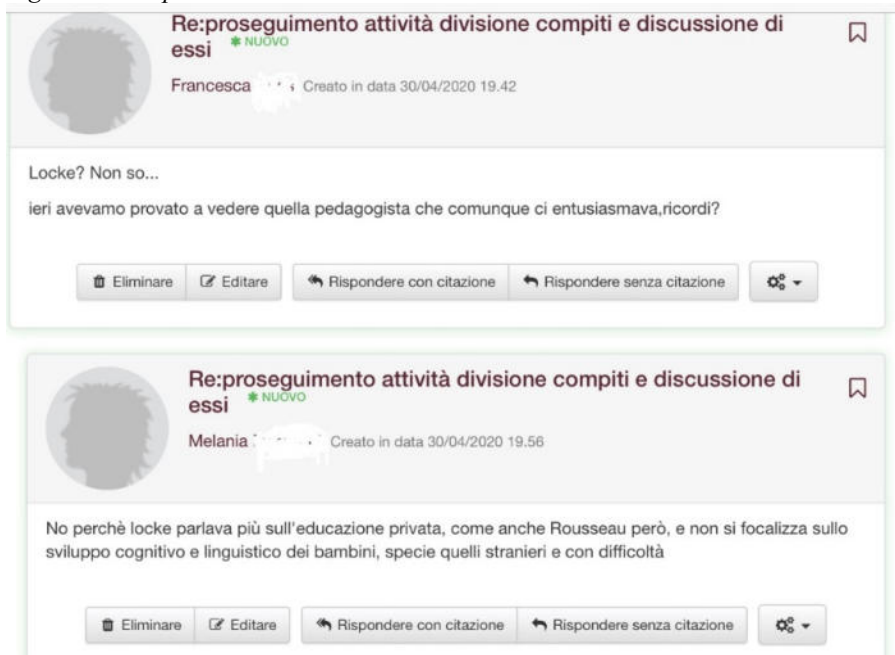
Figura 4 Esempio di Task Level contenutistico studenti-studenti

A livello correttivo le informazioni che gli studenti si sono scambiati hanno riguardato principalmente i diversi modi di interpretare la consegna del docente (Fig.5). Rispetto ad un lavoro individuale dove non c'è la possibilità di avvantaggiarsi di diversi punti di vista interpretativi e il margine di errore si amplia notevolmente, in un lavoro di gruppo il ruolo positivo del feedback è quello di sollecitare gli studenti a soffermarsi maggiormente su una richiesta, analizzandola nel dettaglio in vista di una corretta comprensione e attuazione di scelte di azione adeguate al compito. In questo processo di confronto il livello di riflessione si innalza e sollecita la ricerca di informazioni aggiuntive utili per validare quanto sostenuto.