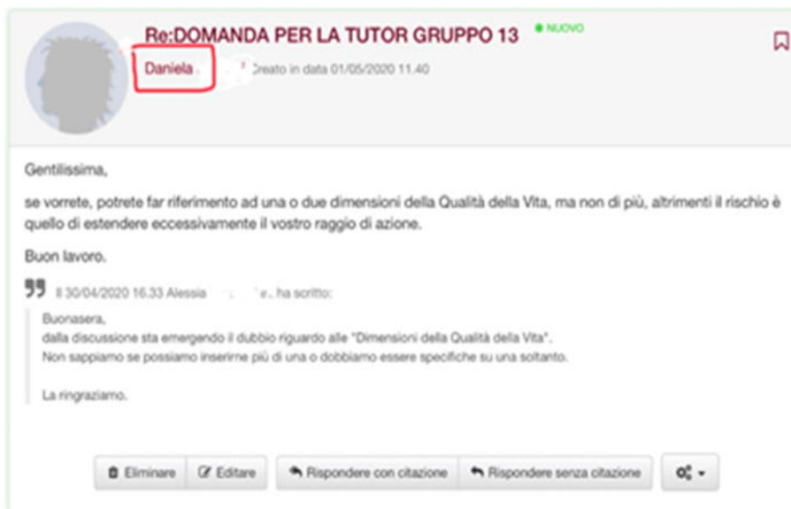
Figura 1 Esempio di Task Level tutor-studenti

In relazione al primo livello, Task Level, il feedback fornito ha riguardato suggerimenti di carattere contenutistico utili agli studenti per proseguire nel lavoro, con l'evidenziazione dei rischi connessi in relazione a determinate tipologie di scelte da loro potenzialmente percorribili (Fig.1). L'informazione all'interno del forum, seppure rivolta ad uno specifico gruppo è diventata accessibile a tutti gli altri gruppi (a differenza di quanto avviene nel lavoro con i gruppi in presenza).