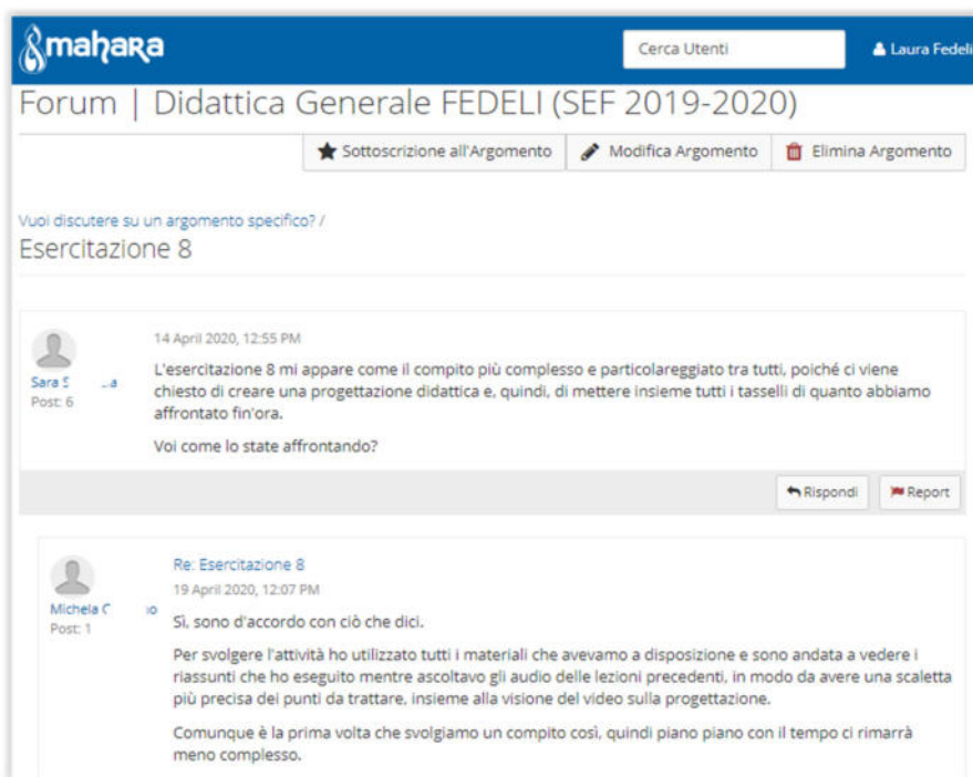
Figura 9. Estratto di una discussione nel forum dell'ambiente e-portfolio.

Ci si riferisce a situazioni in cui lo studente prende l'iniziativa di creare un'occasione di confronto e di scambio al di là delle occasioni offerte in modo esplicito dal docente, esempi di queste occorrenze sono i commenti alle lezioni audio (podcast) (Fig. 8) o gli interventi liberi nei forum dell'ambiente e-portfolio (Fig.9).