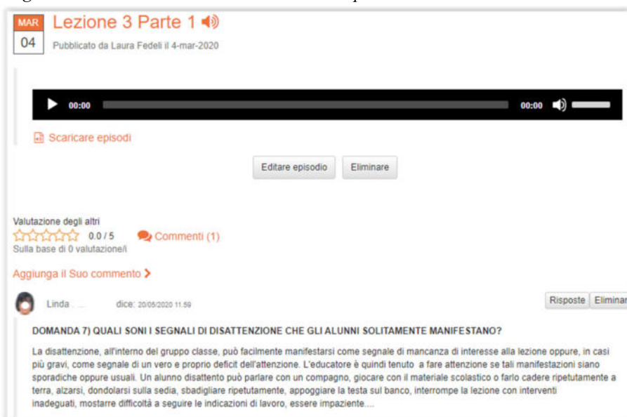
Figura 8. Commento ad un contenuto audio da parte di uno studente

Le esercitazioni si sono svolte in modalità asincrona all'interno della piattaforma didattica e sono state integrate con sessioni di video-chat periodiche per offrire l'opportunità di socializzare i feedback individuali (quando ritenuto opportuno dallo studente) e avere l'opportunità di uno scambio dialogico diretto con il docente e con i pari. Dalle esplicitazioni emerse durante tali sessioni e nelle interviste si evidenzia da parte dello studente la necessità di avere una netta percezione di inclusione nel gruppo classe per poter attribuire valore al processo di feedback e tale percezione si reifica maggiormente nelle occasioni di confronto sincrono in cui l'interazione appare, per lo studente, più efficace da un punto di vista della motivazione, sia