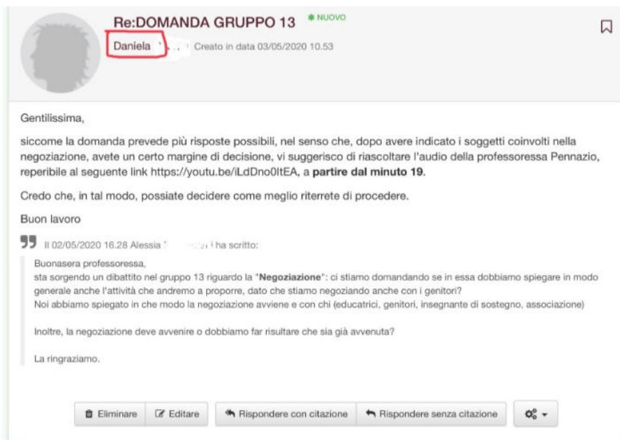
Figura 2 Esempio di Process Level tutor-studenti

In relazione al terzo livello, Self regulation , l'emissione del feedback è stata spesso attivata a partire da un'azione di monitoraggio svolta dalle docenti e dalle tutor sulle attività in corso di svolgimento da parte degli studenti. In particolare, le sollecitazioni hanno avuto l'obiettivo di far riflettere gli studenti sulle modalità di lavoro messe in pratica e ritenute indispensabili all'interno di un lavoro di gruppo (Fig.3). La possibilità offerta dalla wiki di rendere lo spazio di lavoro costantemente visionabile alle docenti, in momenti differenti senza perdere la dimensione complessiva delle interazioni (a differenza di quanto accade in presenza) ha consentito di analizzare le dinamiche di lavoro fornendo feedback tempestivi per un loro progressivo perfezionamento.