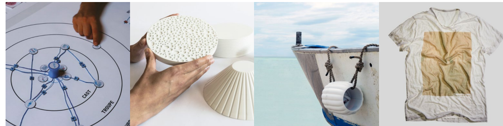
In copertina Sea of Lights – Below the water