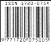
Immagine di copertina

C. Pierluisi, Tritici da tavolo. Paris sequences.