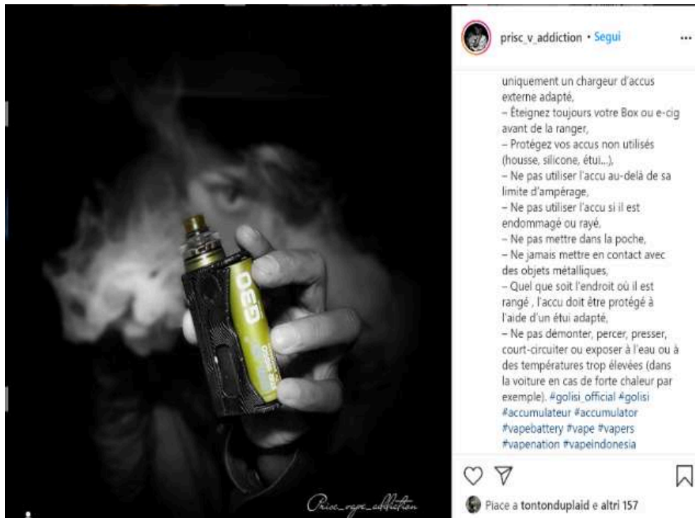
Figure 5 Liste de prescriptions et proscriptions