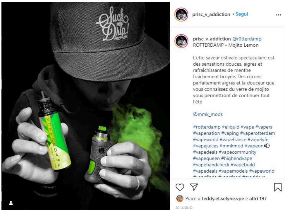
Figure 3 Prisc_v_addiction