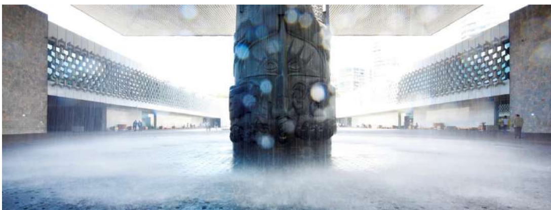
Figura 2. Immagine presente in home page sul sito web del Museo Nacional de Antropologi.

Anche il Museo Nacional de Antropologia propone una home page dinamica, dove vengono mostrate immagini a rotazione sulle attrazioni del Museo, dalle collezioni permanenti sugli Aztechi, Maya e altri antichi popoli messicani, alle mostre temporanee, passando per le visite guidate e gli eventi organizzati dallo staff come laboratori e conferenze.