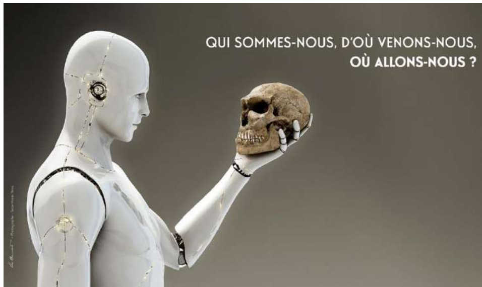
Figura 1. Immagine in home page sul sito web del Musée de l'Homme.

Il testo presente nell'immagine sopra riportata Qui sommes-nous, D'Où venons-nous, Où allons-nous? oltre ad essere un riferimento all'opera del pittore Paul Gauguin (1848-1903), tratta uno dei principi cardini dell'Antropologia contemporanea, ovvero il principio secondo cui, alla luce delle scoperte fatte dagli scienziati contemporanei del Neodarwinismo, l'evoluzione dell'uomo non sia stata lineare, ma che più specie di ominidi abbiano convissuto contemporaneamente fino alla progressiva estinzione e che soltanto Homo sapiens sapiens sia sopravvissuto (Barbujani, 2006; Guerci, 2007). Quindi il Chi siamo, Da dove veniamo e dove andiamo? esprime una tesi molto forte per gli esperti del settore e contemporaneamente attrae ed incuriosisce il grande pubblico, riuscendo a sfatare la credenza del museo etnografico come destinato soltanto a ricercatori e a studiosi.