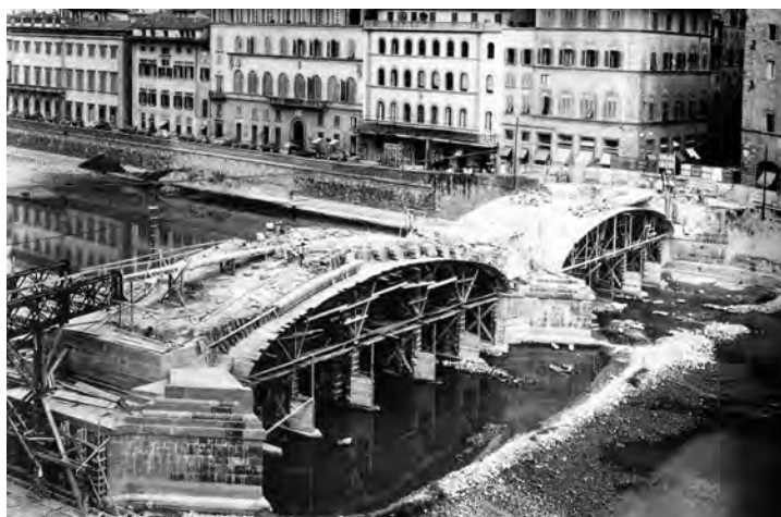
Fig. 2. Firenze, il ponte a Santa Trinita durante la ricostruzione, 1956. Minato dai nazisti, il ponte è ricostruito dopo un lungo dibattito facendo appello alle ragioni etiche della conservazione della memoria, piuttosto che agli scrupoli morali sull'autenticità della materia (da BELLUZZI, BELLI 2003).

Questa duplice valenza si è manifestata sin dai tempi più antichi: se le Variae di Aurelio Cassiodoro (VI secolo d.C.), oggetto di recenti riletture 13 , mostrano già la presenza di una specifica precettistica conservativa finalizzata a preservare l'integrità degli originali, la coeva lettera di Belisario a Totila (546 d.C. circa) spicca per il precocissimo richiamo al valore universale della conservazione di Roma come dovere morale nei confronti degli