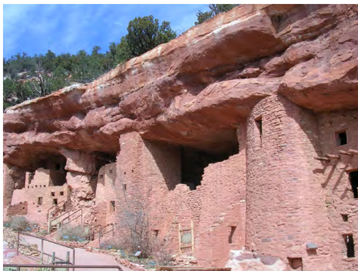
Fig. 8. Colorado Springs, USA: il Garden of the Gods , chiaro esempio della volontà di conservare, restaurare e musealizzare le tracce ancora esistenti della cultura autoctona americana. Tuttavia la maggior parte delle architetture presentano consistenti interventi di ripristino a fronte di un paesaggio che mantiene i suoi originari caratteri naturali.

Pertanto l'interrogativo che qui vogliamo porre è se sia giusto trovare principi comuni e linee guida condivise; se debba prevaricare l'identità culturale di ogni singolo paese (come suggerito dalla dichiarazione di Nara) o se bisogna trovare un compromesso e su quali piani. Innanzi tutto sarebbe auspicabile una revisione critica della Dichiarazione di Nara in cui le specificità culturali non debbano essere rispettate soltanto nei paesi con differenti concezioni rispetto alla visione euro-centrica della tutela ma