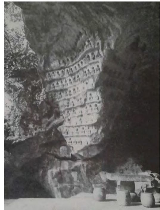
Fig. 2. Cina orientale: i sedili di pietra fotografati da Roberto Pane all'interno di una grotta dedicata al culto di Budda (da PANE 1980).

conferiscono maggior valore al secondo e viceversa (si rilegga, in tal senso l'opera di Pausania) 4 ; ribadire l'importanza della manutenzione costante a garanzia della durabilità dell'opera a tal punto da far sorgere il dubbio se l'opera dovesse considerarsi ancora autentica o meno come nel caso della nave di Teseo nelle Vite di Plutarco 5 ; quesito che si ponevano non tanto i 'restauratori' quanto i filosofi. E in passato tali aspetti, sorprendentemente, legavano maggiormente le concezioni conservative di paesi geograficamente lontani, più di quanto si faccia ora come testimonia il canto di Han Yü 6 (820 a.C.),