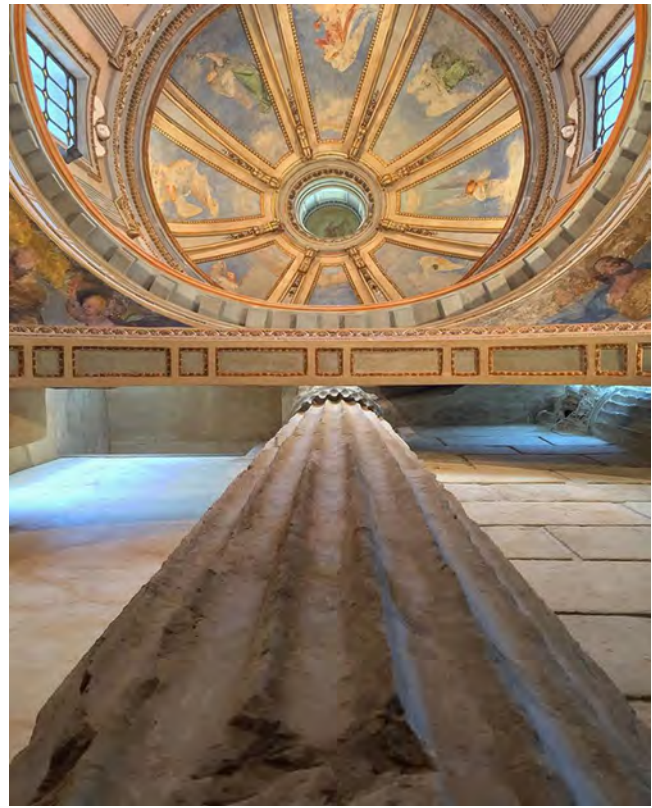
Figg. 5-6. Pozzuoli. Tempio-Duomo. L'intervento al Tempio Duomo esprime da solo la complessità delle infinite possibilità espressive per risolvere lacune architettoniche e rispettare precisi dettami liturgici. Le scelte in questo caso si sono state basate su di un delicato rapporto e sull'interazione tra competenze diverse, nell'ottica di una sintesi interdisciplinare necessaria per affrontare il restauro. Vista delle stratificazioni, in particolare della parte barocca prima del restauro e, con una delle colonne del tempio augusteo, dopo l'intervento, frutto del lavoro del gruppo di progettazione diretto da M. Dezzi Bardeschi.

materiali un valore estetico che si esprime attraverso la conservazione la fisicità della materia – tema argomentato nella storia del restauro da più di un secolo –, il progetto del berlinese Neue Museum di David Chipperfield 17 , o il precedente bistrot dell'Hotel Saint-James a Bouliac di Jean Nouvel hanno accolto le valenze dell'estetica del vissuto. Il 'mezzo pollice' ruskiniano e il valore di antichità hanno loro attribuito dunque, forza progettuale.