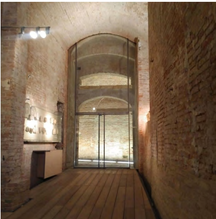
Fig. 3. Siena. Complesso museale di S. Maria della Scala. Il progetto di Guido Canali trasforma il meccanismo espositivo in un'esplorazione dell'architettura che si attiva, oltre che con gli articolati percorsi all'interno del complesso, anche attraverso la percezione della complessità materica delle compagini murarie (foto B.G. Marino 2016).

non tanto all'interno della diatriba del voto contrario o favorevole al restauro cosiddetto à l'identique ; tantomeno in quella della considerazione (o opposizione) al riutilizzo dell'edificio con consistenti parti di sacrificio dei suoi elementi preesistenti. Infatti, per quanto riguarda il primo punto, il rifacimento 'dov'era e com'era' non può essere considerato restauro. Decenni, se non un secolo, di elaborazione critica all'interno della disciplina ne dimostra l'insussistenza: quella della riconfigurazione à l'identique è un'operazione fuori campo, che, mossa precipuamente da elementi esogeni (economici, politici, opportunità contestuali, traumi della memoria collettiva, etc.), rende nullo il significato del 'progetto', privato appunto dei suoi presupposti, confinandolo nella scelta dei termini tecnici di come tradurre in realtà un'esigenza tipicamente rappresentativa di un simbolo che deve riaffermare nell'iconicità la sua forza. È anche vero che l'architettura, e con essa il suo progetto, è in sostanza il frutto di una particolare visione economica, politica e una conseguenza di opportunità contestuali. Questo è ovvio. Ma è una questione di 'pesi' e cioè di come e quanto la realizzazione sia caricata da ciascuno dei fattori e di come e di quanto essa sia di interesse per la collettività in un più ampio senso di ricadute sul suo futuro.