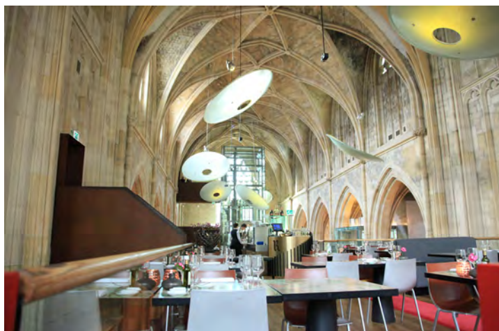
Fig. 4. Maastricht, ex chiesa del convento dei crociferi, sconsacrata e convertita nell'albergo di lusso Kruisenherhotel, inserito nel circuito dei Design Hotels e inaugurato nel 2005. Col pretesto della reversibilità, la navata è soppalcata, offrendo spazio al piano superiore per un ristorante stellato. Tanto la funzione che gli arredi appaiono totalmente estranei al contesto originario della chiesa, le cui mura sono ridotte, anche qui, a mero involucro.

di Alois Riegl, che nel suo Der moderne Denkmalkultus (1903), pone la questione della tutela e del restauro al centro di una teoria assiologica e dunque “non dogmatica e relativista del monumento storico” 26 . Ciò nonostante, alcune riflessioni di Riegl puntano verso istanze morali nei confronti della salvaguardia della “vita fisica”, “premessa per ogni vita psichica”, come nel caso di un edificio che minaccia di crollare, dove il valore d’uso deve prevalere su ogni altro, a tutela della pubblica incolumità 27 . Nei decenni successivi, pur nella generale tendenza a definire precetti universalmente condivisi – testimoniata dal voto conclusivo della conferenza di Atene del 1931 – si afferma progressivamente la stretta relazione tra