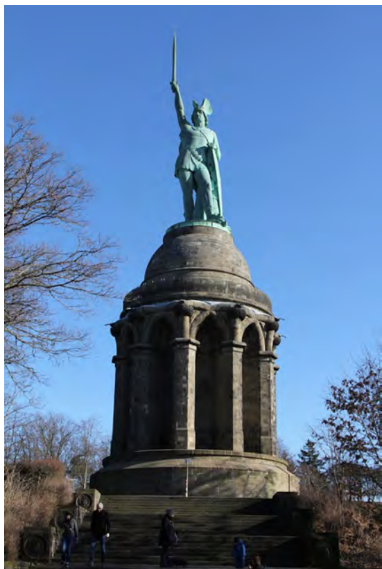
Fig. 5. Detmold, Germania: il Monumento di Arminio ( Hermannsdenkmal ) situato nella regione Renania Settentrionale – Vestfalia, nella parte meridionale della Teutoburg Wald . Esso venne realizzato tra il 1838 ed il 1875 su progetto di Ernst von Bandel e celebra le imprese del condottiero come esempio di nazionalismo dell'Impero tedesco prima e successivamente del regime nazista.

Infine, una lettura dell'opera di William Morris News from Nowhere impedirebbe di considerare come originale e attuale la nozione di 'non luogo' (sostenibilità ambientale) di cui tanti accademici e professionisti si reputano addirittura inventori 15 . Quindi, studi più attenti farebbero individuare,