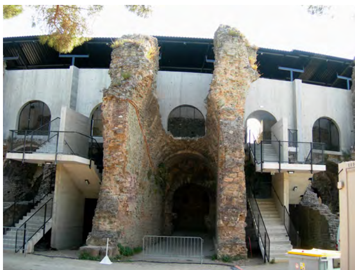
Fig. 6. Fréjus: l'anfiteatro romano in cui ragioni economiche e turistiche hanno 'giustificato' un intervento poco condivisibile (Francesco Flavigny, architetto-capo dei monumenti storici,) riducendo il monumento a un mero contenitore per moderne manifestazioni ludiche. È questo uno dei casi in cui si avverte una valorizzazione che va contro la conservazione (foto E. Romeo).

Ciò non solo scardinerebbe le tradizionali categorie del restauro (stilistico, storico, filologico, ecc.), categorie legate, sempre rispetto alle concezioni storiografiche, agli aspetti formali, stilistici, ai materiali di cui