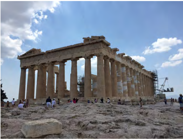
Fig. 2. Atene. Il Partenone in una recentissima fase degli interventi di restauro, del quale è ancora visibile il cantiere in corso. I lavori hanno, di fatto, portato alla reintegrazione di ampie parti di materiale lapideo modificando l'aspetto storico frutto dei restauri precedenti e attenuando ulteriormente la natura archeologica della preesistenza.