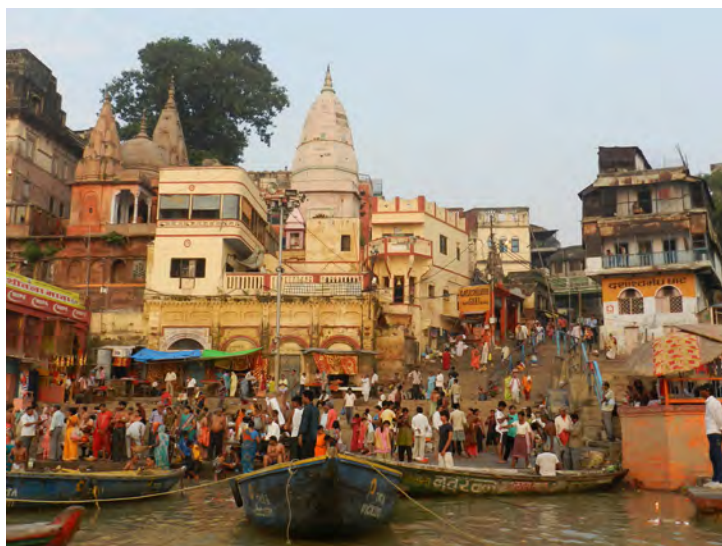
Fig. 7. Varanasi, India: un tratto del Gange dove appare evidente la mancanza di interventi sia conservativi che manutentivi delle architetture lungo le rive del fiume. Tale approccio è legato strettamente al rapporto induista tra la vita e la morte (con forti caratterizzazioni antropologiche e religiose) che si manifesta apertamente in entrambe le sponde.

Una lettura di fenomeni antropologici e sociali che potrebbe favorire la comprensione di principi