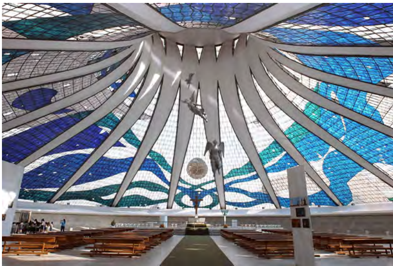
Fig. 10. Brasilia, Brasile: la cattedrale, progettata da Oscar Niemeyer dopo gli interventi di restauro (prima riforma) attraverso i quali si è voluta riaffermare la tradizione popolare rispetto alla sobrietà formale dell'organismo architettonico. Le vetrate originarie furono sostituite con elementi artigianali e colorati progettati da Perretti; a loro volta queste hanno lasciato il posto, tra il 2009 e il 2012 (terza riforma) a nuovi elementi prodotti industrialmente.

si possa prendere in considerazioni che tali specificità possono oggi rintracciarsi – a causa dei continui flussi migratori – anche presso i confini nazionali dei paesi occidentali.