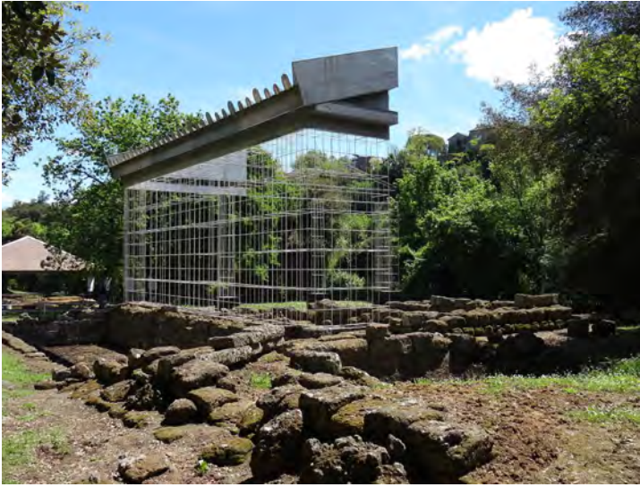
Fig. 7. Veio (Roma), Tempio di Apollo. Restituzione dei volumi con struttura a filo di ferro realizzata in tubolari in acciaio da Franco Ceschi nel 1992. Progettato con un intento temporaneo, l'intervento è stato completato da pannelli che riproducono alcuni elementi della trabeazione e del frontone, divenendo permanente (da GIZZI 2003 e Wikipedia).

più recentemente col già citato Jonas 47 .