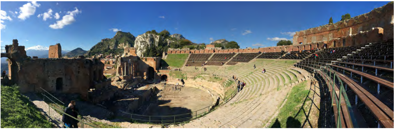
Fig. 10. Taormina, teatro Greco. Dopo oltre due millenni, il teatro è ancora oggi utilizzato per rappresentazioni e concerti. Gli interventi realizzati per rendere possibili le funzioni attuali in accordo con le norme di sicurezza non hanno alterato la sua identità né il suo rapporto con lo straordinario contesto paesaggistico circostante.

nella sua velleitaria e improbabile trasparenza, non è né architettura – non restituendo la condizione spaziale originaria (ammesso che fosse legittimo riproporla, a fronte di un rudere secolare ormai integrato nel paesaggio) – né struttura protettiva, non offrendo riparo dalle intemperie ai poveri resti murari. Tuttavia esso insiste, questa volta in modo massivo e violento, con le sue 7 tonnellate di peso, sulle murature autentiche della basilica, per assicurare il sostegno di una struttura complessa e costosa, destinata certamente a un rapido processo di degrado, con possibili ricadute anche sulla materia del bene che si voleva inizialmente proteggere.