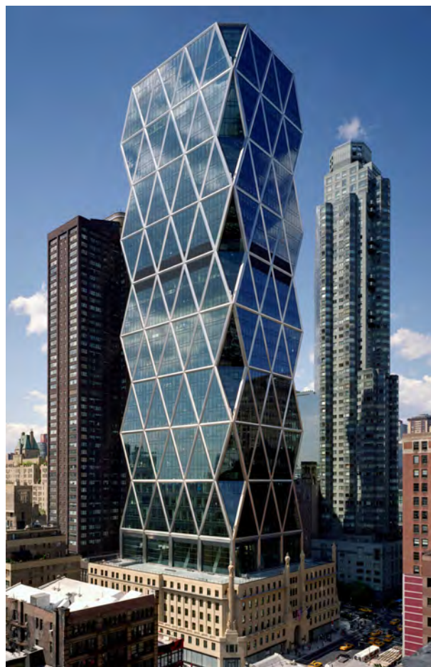
Fig. 1. New York. Edificio della Hearst Corporation, progetto di Norman Foster. L’edificio preesistente, l’International Magazine Building, è del 1926-28 e nel 1988 viene dichiarato “monumento importante nella tradizione architettonica di New York”, anche se solo per l’involucro esterno. Foster svuota l’interno dell’edificio e pratica il ‘brutale innesto’ della sua torre (da MULAZZANI 2006).

Il punto di partenza della questione del restauro si situa allora probabilmente altrove: non solo e