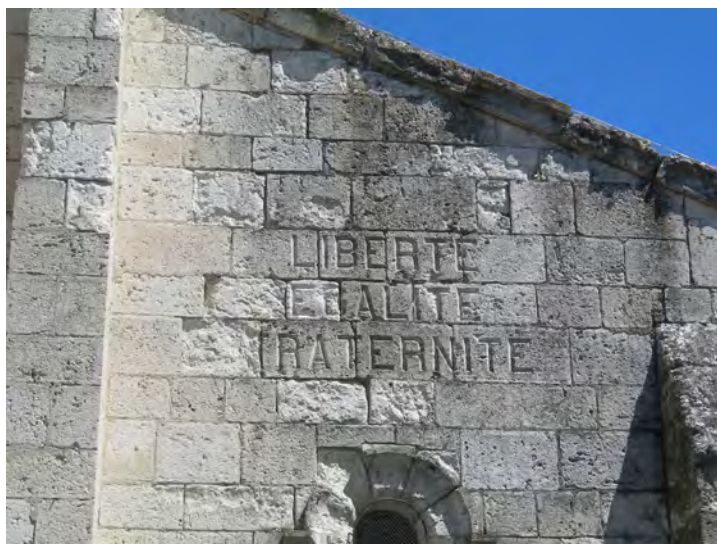
Fig. 4. Moissac, Francia: chiesa di Saint-Jacques. Particolare delle scritte con il motto liberté, égalité, fraternité! È significativo notare come dopo gli interventi di restauro della chiesa, eseguiti dall'architetto Théodore Olivier tra il 1850 e il 1874, siano state conservate le tracce della Rivoluzione.