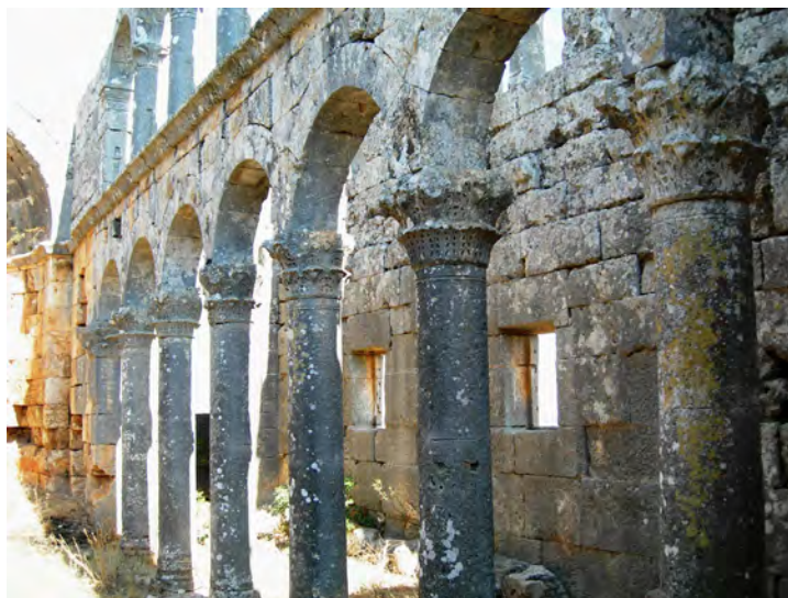
Fig. 9. Cambazli, Turchia: la basilica, eccezionalmente integra nei suoi elementi architettonici, è uno dei più chiari esempi della scarsa attenzione da parte delle politiche di tutela turche nei confronti delle architetture cristiane anteriori all'avvento della religione islamica.