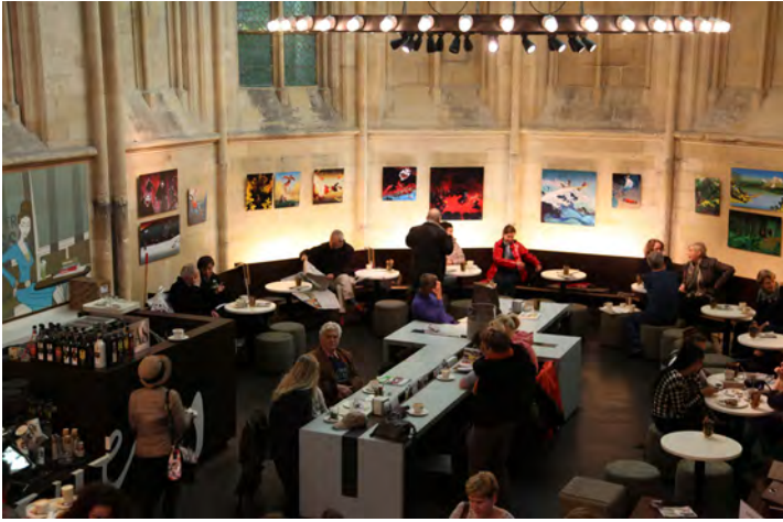
Fig. 3. Maastricht, ex chiesa domenicana del XIII secolo, sconsacrata e convertita nella libreria “Selexyz Dominicanen”, inaugurata nel 2006. L’abside medioevale, ridotta a mero involucro, ospita la caffetteria del negozio, mentre gli arredi sono disposti ora in modo indifferente nei confronti della spazialità originaria, ora in modo espressamente irriverente, come nel caso del tavolo centrale cruciforme.

con l’orientamento positivista dominante, volto a inquadrare anche il problema del restauro in una tassonomia, sono state così formulate massime divenute celebri – si pensi a quella di Adolphe-Napoléon Didron del 1839, poi ripresa da Camillo Boito 17 – ma anche opportune precisazioni relativiste, come la messa in guardia di Eugène E. Viollet-le-Duc contro i principi assoluti nel restauro, che possono condurre all’assurdo 18 . L’impostazione precettistica ha abbondato anche in Italia, come testimonia l’opera di Boito in favore di una normativa e il suo frequente ricorso a massime di facile diffusione. Valga per tutti il precetto in versi, noto soprattutto per il passaggio “far io devo così che ognun