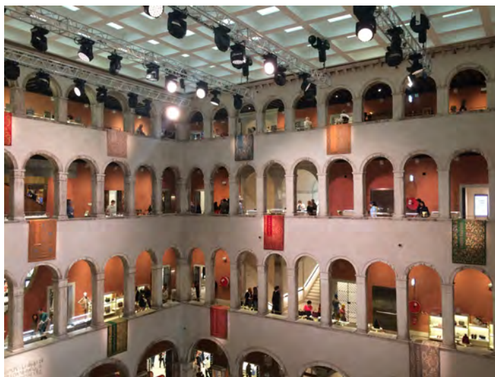
Fig. 6. Venezia, Fondaco dei Tedeschi, convertito in grande magazzino di lusso con un intervento progettato e diretto dallo studio OMA di Rem Koolhaas, inaugurato il 1° ottobre 2016. Dopo un lungo braccio di ferro con il MiBACT, la trasformazione dell'antico edificio cinquecentesco, destinato a mercato e residenze della comunità tedesca a Venezia, ha fortemente alterato la preesistenza, insediando una funzione che appare in netto contrasto con l'identità raccolta della città lagunare. Col pretesto di considerare l'edificio già alterato dagli interventi novecenteschi di Ferdinando Forlati, il progettista ha operato scelte molto discutibili, tra cui spiccano la copertura della corte, la realizzazione di una 'superaltana' panoramica e l'inserimento di scale mobili che tagliano gli orizzontamenti (da CRISTINELLI 2014 e Wikipedia ).

Ma tornando alla Carta di Venezia, e fermi restando i suoi innegabili meriti, nonché la sostanziale attualità di molti dei suoi principi, essa può anche essere considerata – ai fini del nostro discorso – come una eloquente testimonianza di una Weltanschauung egemonica dell'etica del restauro: quella occidentale ed eurocentrica della cultura che la produsse 42 . Ciò ha costituito certamente uno dei limiti principali del documento, stigmatizzato in seguito da autorevoli studiosi, tra cui Françoise Choay 43 , nonché dalle culture extraeuropee, come quella australiana, che già a partire dal 1977 ha marcato la propria distanza, redigendo la cosiddetta Burra Charter 44 . Più tardi, nel 1994, a trent'anni esatti di distanza dal congresso di Venezia, la Dichiarazione di Nara ha sottolineato la relatività dei giudizi in merito alla nozione