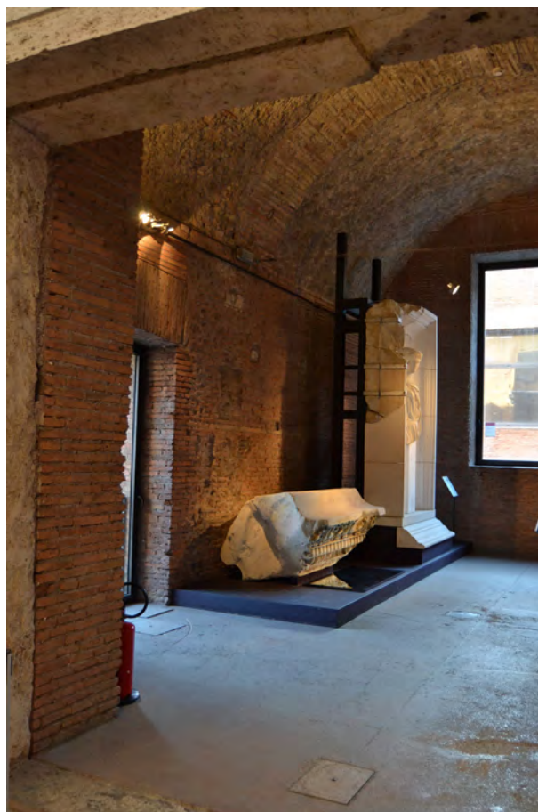
Fig. 4. Roma, Mercati Traianei, una delle sale espositive della Grande Aula. Il complesso è stato oggetto di una composita campagna di interventi di restauro e di miglioramento dell'accessibilità e della fruizione tra cui quello curato da Luigi Franciosini e Riccardo D'Aquino.

D'altro canto, sensibili a una cultura che ravvede nella conservazione delle testimonianze