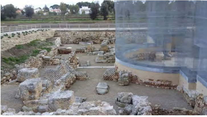
Fig. 9. Siponto (Foggia), Basilica paleocristiana nei pressi della chiesa di S. Maria Maggiore, ricomposizione spaziale con installazione artistica di Edoardo Tresoldi. Visto alla luce del giorno, l'intervento rivela tutta la sua incongruenza, non soltanto concettuale, ma soprattutto conservativa, insistendo pesantemente e irreversibilmente sui poveri resti murari dell'antica basilica, le cui strutture non sono nemmeno protette dalle intemperie, come doveva essere negli intenti iniziali.

riduzionismo proiettato esclusivamente sulle contingenze attuali e sull'evento', come sembra invece predicare la spettacolarizzazione mediatica dell'architettura contemporanea. In questa chiave di lettura le questioni di tutela e restauro assumono una dimensione che va ben al di là del mero intervento tecnico o della problematica estetica, per abbracciare gli ambiti più vasti della sostenibilità, del contenimento dei consumi, dell'impiego giudizioso delle risorse economiche, mentre gran parte delle scelte apparentemente condivisibili sul piano esclusivamente estetico e contingente si rivelano fallaci. È il caso