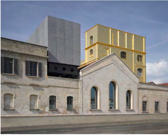
Fig. 5. Milano, Fondazione Prada. Frutto di un progetto di rifunzionalizzazione di una vecchia distilleria, posta nella zona industriale a sud della città, l'intervento, progettato e diretto dallo studio OMA di Rem Koolhaas e inaugurato in occasione di EXPO 2015, restituisce uno spazio per l'arte in un'area di margine di Milano, conservando gran parte delle strutture rispettandone l'autenticità, mentre i nuovi inserti, pur occhieggiando alla spettacolarizzazione del gesto contemporaneo, come nella Haunted House dipinta in oro, non inficiano l'identità originaria del sito.

della memoria 31 , da attuarsi piuttosto con una pietas che tenga conto della lacerazione prodotta, in senso anche psichico, dalla violenza delle distruzioni. Così, in merito alla diatriba sulla ricostruzione del Ponte a Santa Trinita, egli non esita a dichiarare, nel 1946, che vi sono “occasioni nelle quali una bugia possa riuscire più morale di una verità [...] quando essa è pronunziata in nome di qualche cosa che è più alta della verità e che si chiama misericordia” 32 . Rifiutando dunque la scorciatoia delle indicazioni precettistiche, Pane sposta i propri interessi sul secondo dei due aspetti richiamati in precedenza, ovvero la dimensione etica intesa come ragione ultima della conservazione, in una prospettiva di più ampia portata. Vengono dunque progressivamente alla luce, nel corso dell'evoluzione del suo pensiero, istanze morali e psicologiche che devono guidare, in senso più generale, l'azione del restauro 33 .