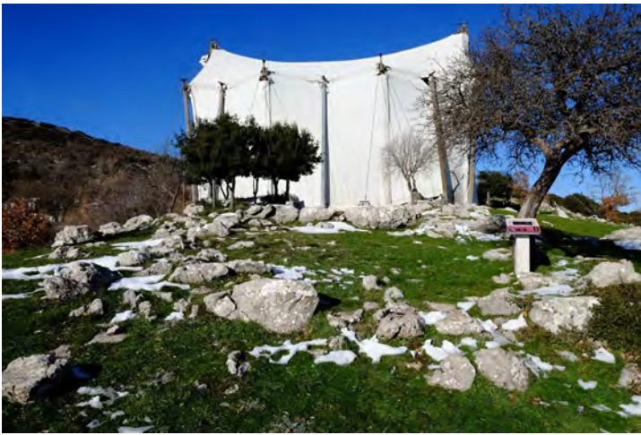
Fig. 1. Bassae, Grecia: il tempio di Apollo Epicurio in cui gli interventi di protezione creano un'evidente cesura tra rudere archeologico e paesaggio storicizzato (foto E. Romeo).

in cui l'importanza documentale dei 'tamburi di pietra' (Fig. 2) suggerì al poeta cinese di immaginare tali reperti restaurati ed esposti in un tempio confuciano 7 . Esattamente ciò che si auspicava da parte degli ateniesi, indipendentemente dal valore di autenticità, per la nave di Teseo.