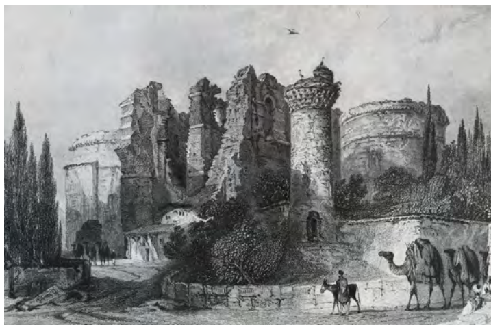
Fig. 3. Pergamo, Turchia: l'incisione di Thomas Allom (1840 circa) mostra con chiarezza le numerose stratificazioni del Serapeion : le strutture classiche del santuario di culto pagano con gli edifici di forma circolare ai lati della cella; la basilica bizantina, dedicata a san Giovanni Evangelista, con in primo piano il crollo dell'abside principale; il minareto che dava accesso alla moschea ricavata proprio in uno degli edifici a pianta centrale, divenuto battistero in età cristiana (da RADT 1984).

Un confronto questo tra cultura francese e cultura inglese tralasciato a tal punto che uno dei maggiori 'luoghi comuni' riporta continui contrasti tra John Ruskin e Eugène E. Viollet le Duc (individuabili come infondati se si analizzasse cronologicamente la produzione scientifica di entrambi) smentiti da Françoise Choay che ne esamina i rapporti definendoli tutt'altro che antitetici 13 . Infatti la studiosa francese ha aperto le porte a una revisione dell'opera dei due maestri: si pensi ai recenti aggiornamenti critici che hanno distinto la produzione didattica e la pubblicistica in Viollet-le-Duc o il suo impegno sociale e politico oppure la consapevolezza con la quale rifiutò il restauro di alcuni edifici (l'abbaziale