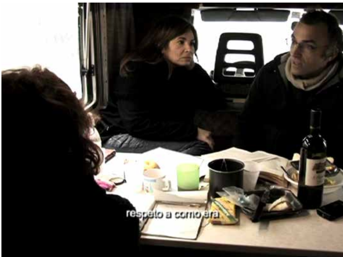
Da Yo no me complico , la messa in scena del backstage

è vero, come sostengono molti autori, che la rivoluzione digitale ha aperto le porte alla sociologia visuale perché ha reso possibile lavorare più autonomamente sulla raccolta e sulla gestione del materiale, va tuttavia anche detto che una certa qualità tecnica è ottenibile solo con l'ausilio di competenze specifiche e un'alta professionalità (Becker, 1998, 2000). Senza il regista, che ci ha accompagnato lungo tutto il lavoro, non avremmo potuto ottenere quella poetica dell'immagine che invece si è cercato di perseguire, così come, senza l'aiuto di esperti di musica elettronica, non avremmo potuto realizzare una colonna sonora così suggestiva.