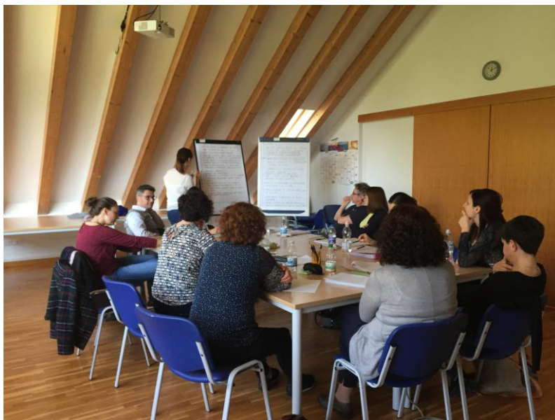
4.2. Corso di formazione aziendale

Durante la formazione venne data molta attenzione al primo salto del PBL: chiarire i termini poco chiari. In questa situazione era importante che i facilitatori comprendessero l'importanza di dedicare molto tempo all'individuazione dei termini non immediatamente chiari, dato che una criticità evidenziata nella ricerca era proprio la incomprensione dei termini tecnici specifici usati dalle altre professioni sanitarie.