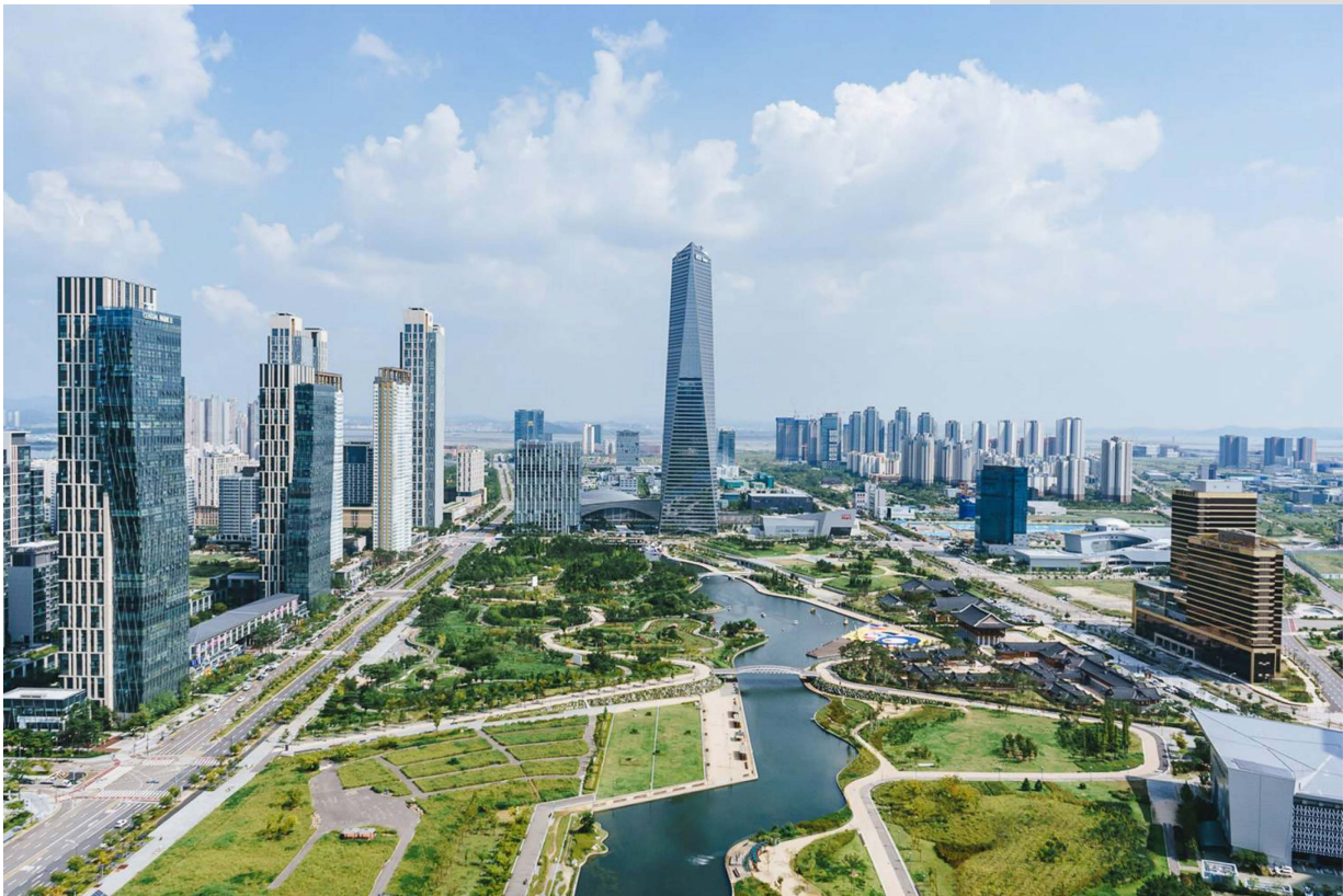
Figure 2. Songdo, South Korea.

Si potrebbe affermare, come sostiene la sociologa S. Sassen, che la tecnologia, ad esempio a Songdo, abbia già hackerato la città. Ma cosa accadrebbe se la città fosse in grado di hackerare la tecnologia – “can cities hack technology?” [13]. Partendo dal presupposto che la città sia un sistema complesso, ma incompleto e che dietro a quella complessità si celi la possibilità di reinventarsi in