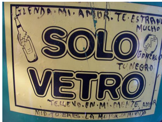
Figura 2 Telenovela 2.