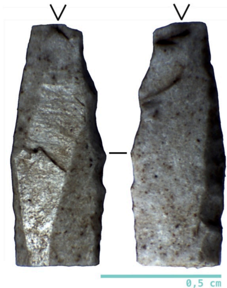
Figura 2. Riparo Bombrini, Frattura da impatto (step) su frammento prossimale di lamella Dufour. Selce francese ( Bédoulien ).