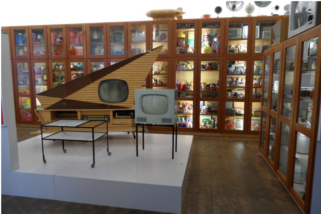
Figura 3. Patrimonializzazione e crisi dei valori: Museum der Dinge, Berlino.

A pagina 51, figura 4. Patrimonializzazione e “consommation mercantile du patrimoine” (F. Choay), galleria delle carte geografiche, Musei vaticani, Roma.