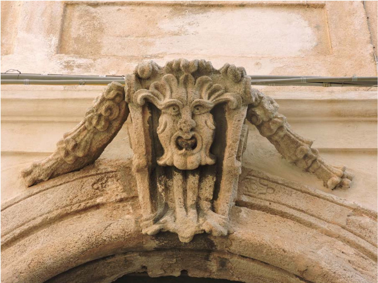
Figura 5. Lo sguardo tecnico-scientifico è un mezzo o un fine? Portale del XVIII secolo, Pizzo (VV).