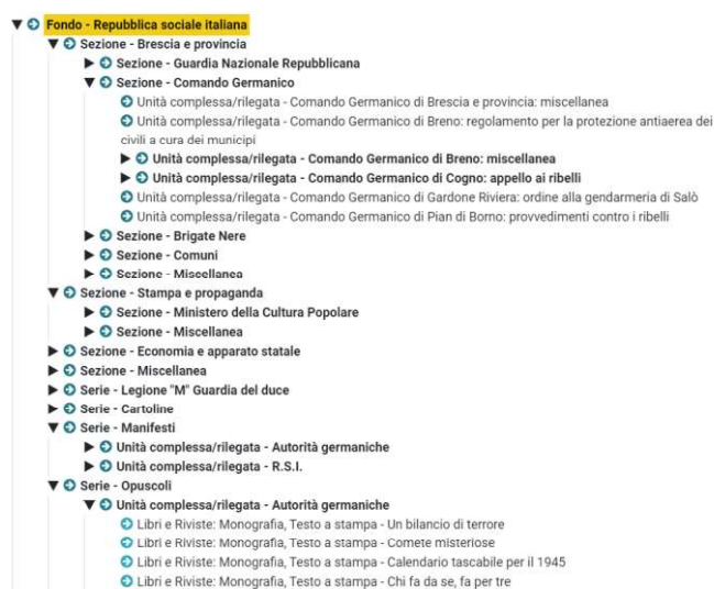
Figura 2. L'albero archivistico di un fondo inserito in Geca, contenente sia risorse archivistiche sia bibliografiche

In GECA trovano piena attuazione tanto gli standard internazionali di dominio, quanto l'interoperabilità con i principali tracciati di interscambio, rappresentando quindi uno strumento utile sia alla granularità delle descrizioni previste dai diversi ambiti di applicazione, sia all'attivazione di relazioni cross dominio. Un esempio in questo senso è dato dalla possibilità fornita dal software di strutturare un albero archivistico (vd. Fig. 2) utilizzando non solo schede di descrizione per complessi archivistici e unità, ma anche schede dedicate a risorse bibliografiche o museali, integrate quindi con la descrizione archivistica [7].