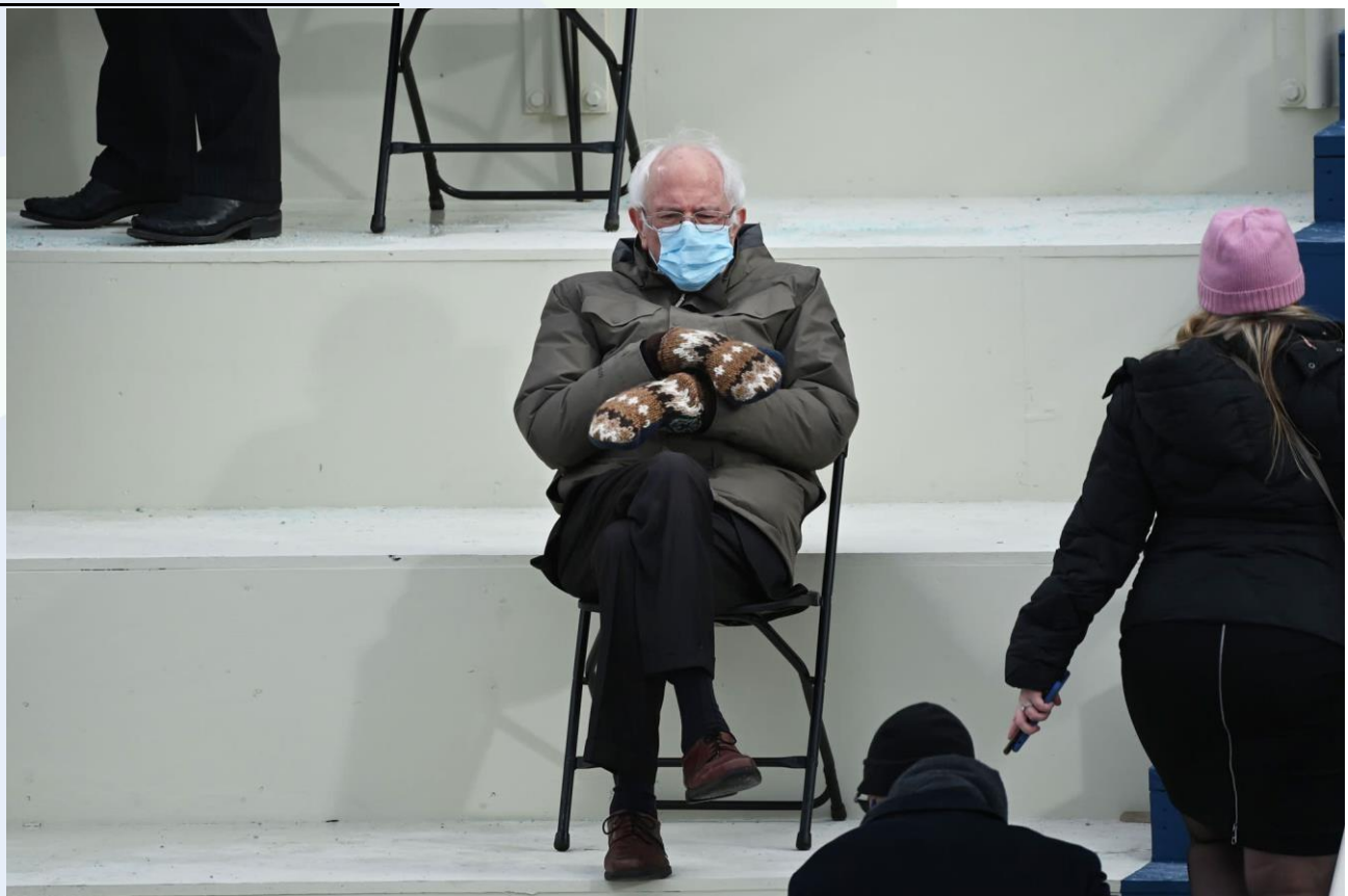
Figura 1 Bernie Sanders

suggerito o implicato da un'asserzione. Tutto ciò che viene lasciato sott'inteso, dipende da un terreno comune socialmente costruito, garantito anche dall'accesso a quei mondi possibili descritti in precedenza. Dire che "Roberta beve" lascia sott'inteso "beve alcol", a meno che non venga reso esplicito "Roberta beve... bibite". Una Realtà Aumentata è come se volesse esplicitare le affordances della Realtà, aggiungendo, in digitale, layer studiati appositamente per creare compresenza esplicite di ipertesti.