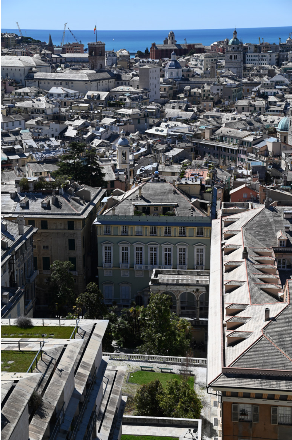
Fig. 1 Genova città verticale: i tetti dalla Spianata di Castelletto con in primo piano le terrazze dell'ampliamento di Franco Albini di Palazzo Tursi e il giardino di Palazzo Lomellini.